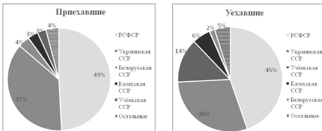
Рис. 1. Распределение пожизненных мигрантов по месту рождения в Крымской области по данным переписи 1989 г.

писи населения. К неместным уроженцам можно отнести жителей региона, родившихся за его пределами, и, соответственно, являющихся межрегиональными или международными мигрантами. Данный подход является широко применяемым в англоязычной научной литературе, однако в отечественной практике изучение миграции на основе сопоставления данных о месте рождения, а также длительности проживания в текущем месте жительства уделяется недостаточно внимания. При этом не в полной мере проработанным остается и понятийный аппарат, что также вызывает проблемы при фиксации тех или иных миграционных явлений [1].